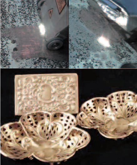
Schonende und kontrollierbare Laserreinigung von Metallen, z.B. Bronze oder Silber