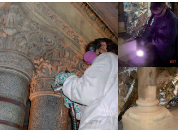
Oxford Museum: großflächige Sandsteinreinigung

Mit dem CleanLASER lassen sich zum Beispiel substanzschädigende Salzablagerungen und Korrosionen entfernen, ohne die natürlich gewachsene Schutzpassivierung von Bronze oder anderen Metallen zu zerstören. Neben Sandstein kann der CleanLASER auch Verschmutzungen von Marmor, Granit, Terracotta und Gips entfernen, ohne die Bauphysik zu beeinflussen. Oftmals lassen sich mit dem fein dosierbaren Laserlicht sogar farbige und pigmentierte Oberflächen vom Ruß und Staub der Jahrhunderte schonend befreien. Selbst die Bearbeitung von Gewebe und Holz ist mit den sehr kurzzeitig einwirkenden Laserpulsen möglich. Durch die bei Lasersystemen für die Restaurierung einmalige, feine Dosierbarkeit der Laserleistung (0-100%) und der Laserintensität sowie wechselbaren Objektiven stehen dem Restaurator alle Einstellmöglichkeiten für eine schonende Bearbeitung zur Verfügung.