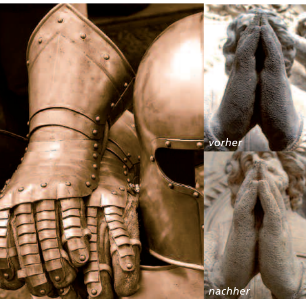
Ob Ritterrüstung oder Skulptur eines Kirchenportals - der CleanLASER ist ein optimales Werkzeug für den Restaurator