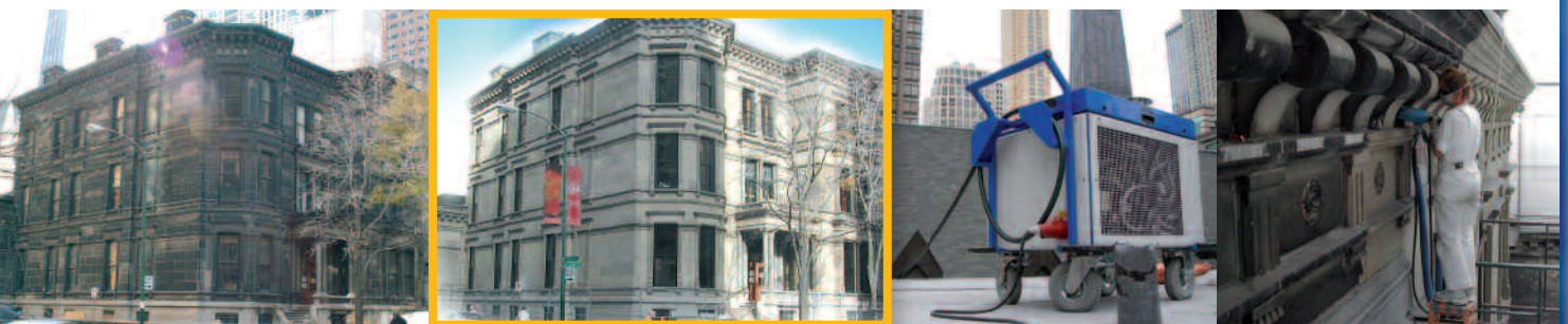
Chicago-City: Restaurierung einer Sandsteinvilla aus dem Jahr 1883, weltweit größtes laserstrahlbasiertes Restaurierungsprojekt, ca. 2500 m 2 Fläche

Restaurieren mit Laserlicht – materialschonend, praktikabel und umweltfreundlich. Gerne beraten wir Sie, wie der CleanLASER auch Ihr kostbares Kunst- oder Bauwerk im „neuen alten“ Glanz erstrahlen lässt.